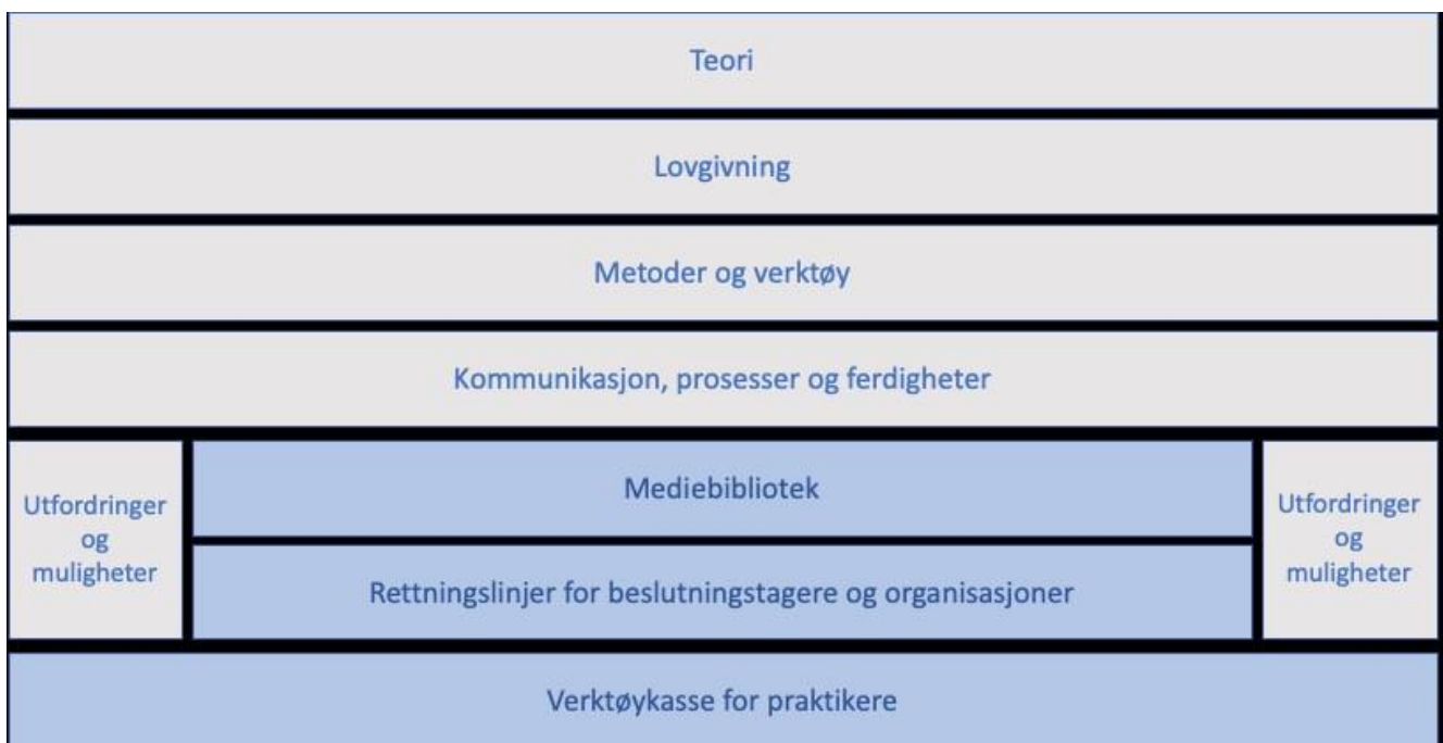
Figur 1 PANDA-konsept (2022)

En rekke utfordringer og muligheter er knyttet til oppgaven med å legge til rette for barns deltagelsesrettigheter. Fagpersoner med forskjellige arbeidsoppgaver i tilknytning til barn, i ulike sammenhenger og i forskjellige land, har pekt på utfordringer og muligheter knyttet til barns deltagelse. I denne rapporten for barnevernsarbeidere fokuseres felles utfordringer og muligheter. Det finnes allerede et betydelig antall publikasjoner, hovedsakelig om utfordringer knyttet til små barns deltagelse og medvirkning. Mulighetene for at også yngre barn medvirker, diskuteres i mindre grad i faglitteraturen. Både muligheter og utfordringer blir beskrevet i denne oversikten.