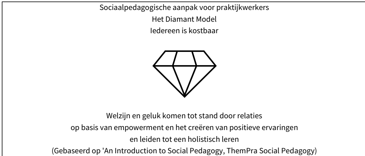
Figuur 2: Het Diamant Model

Kenmerken van de benadering zijn onder meer: respect voor de inherente waarde van kinderen, een geloof in het potentieel van kinderen, onderlinge verbondenheid van gedachten, gevoelens en acties, het fundamentele belang van vertrouwensrelaties en het belang van de scheiding van het professionele, persoonlijke en particuliere zelf in een relatie. Het sociaalpedagogisch kader biedt een manier om de vaak verwaarloosde emotionele dimensies van relationele en communicatieve ontmoetingen tussen praktijkwerkers en kinderen te onderzoeken en ermee om te gaan. Sleutelbegrippen zijn 'haltung', 'hoofd-hart-handen', het 'professionele, persoonlijke en particuliere zelf', 'de gemeenschappelijke derde' en 'wederzijds respect en vertrouwen'. (Figuur 3).