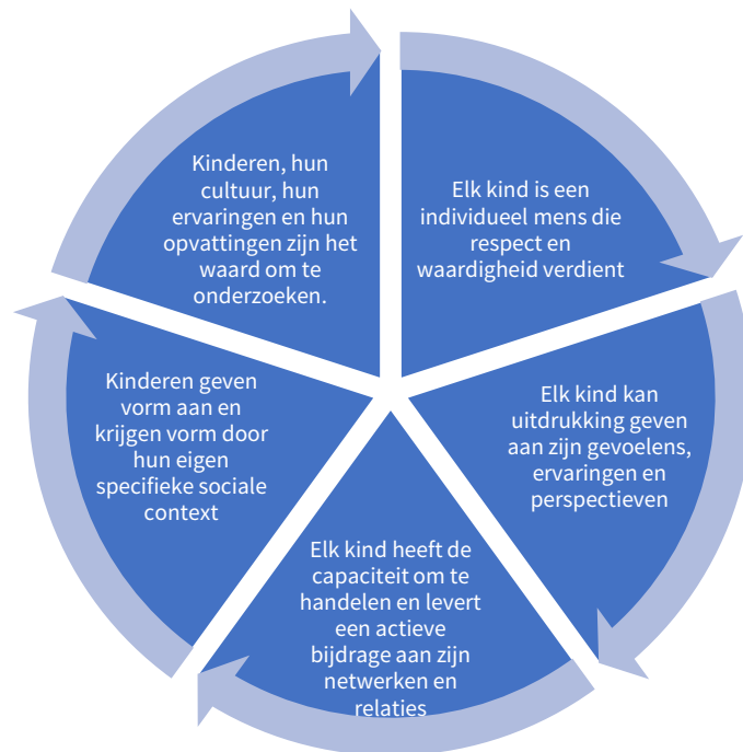
Figuur 1: Sociologie van de kindertijd: opvattingen over elk kind en relevantie voor praktijkwerkers