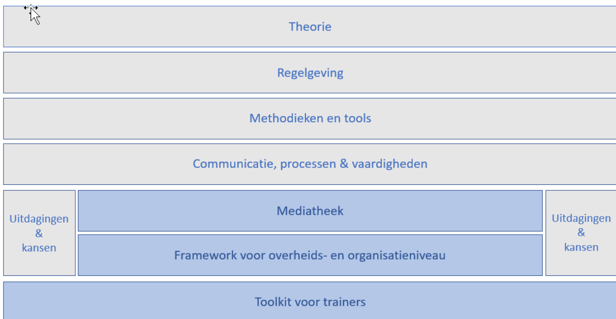
Figuur 1 Panda concept (2022)

Aan de basis van de participatie van kinderen liggen gedeelde theoretische en conceptuele kaders waarvan professionals zich vaak niet bewust zijn. Deze tekst voor praktijkwerkers richt zich op deze theoretische en conceptuele kaders. Het overzicht is niet exhaustief, de meest voorkomende kaders zijn opgenomen. Het doel is