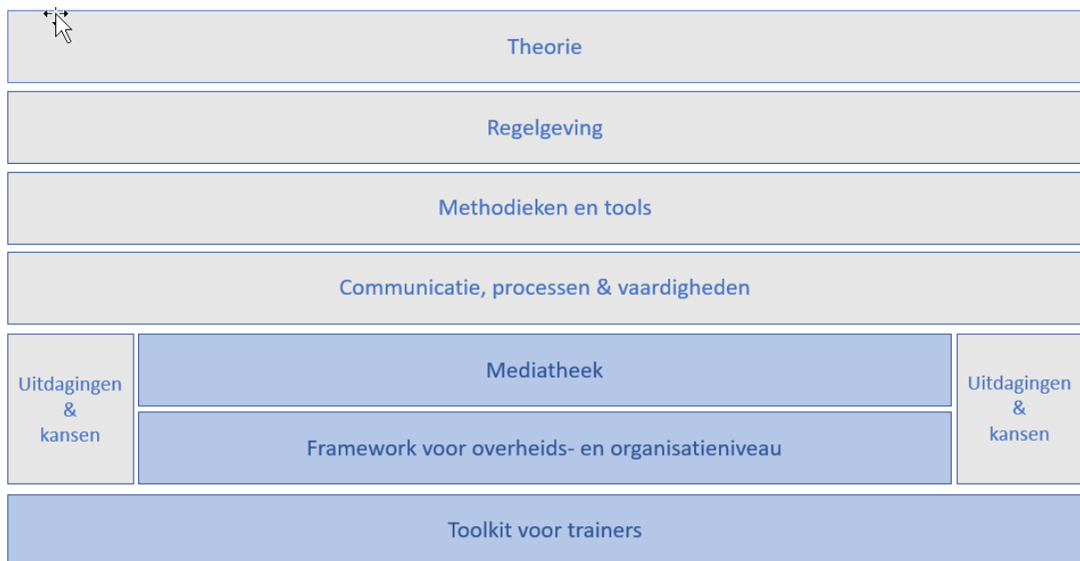
Figuur 1 Panda concept (2022)

Aan het recht op participatie van kinderen liggen gemeenschappelijke internationale kaders ten grondslag, namelijk het Verdrag van de Verenigde Naties inzake de rechten van het kind, alsook specifieke nationale rechtskaders, wettelijke regelgeving, beleidsdocumenten en meer algemene richtlijnen. Deze tekst voor praktijkwerkers gaat in op het internationale kader.